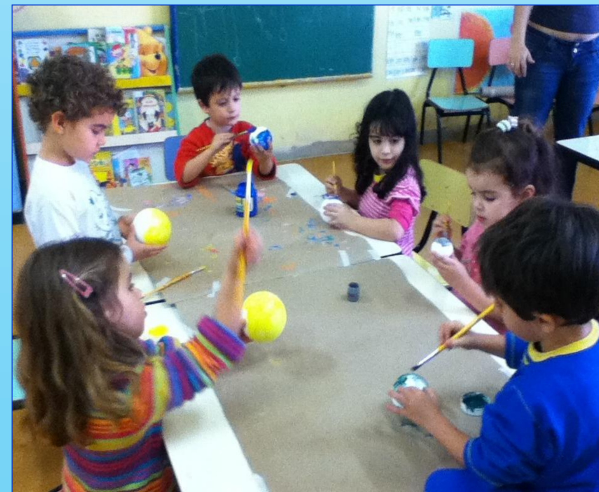
FIGURA 2: Confeção do Planetário MóBILE