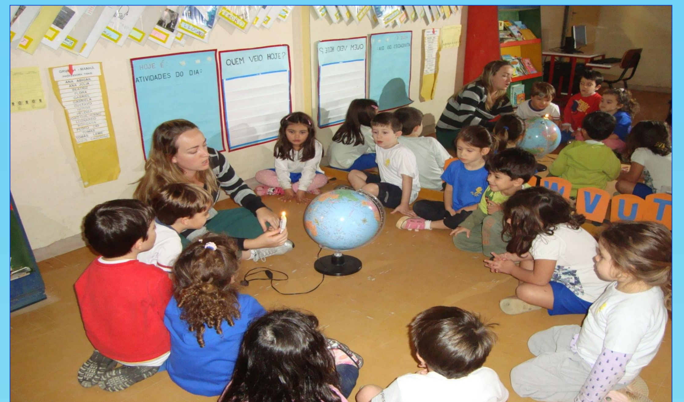
FIGURA 4: Experiência Dia e Noite