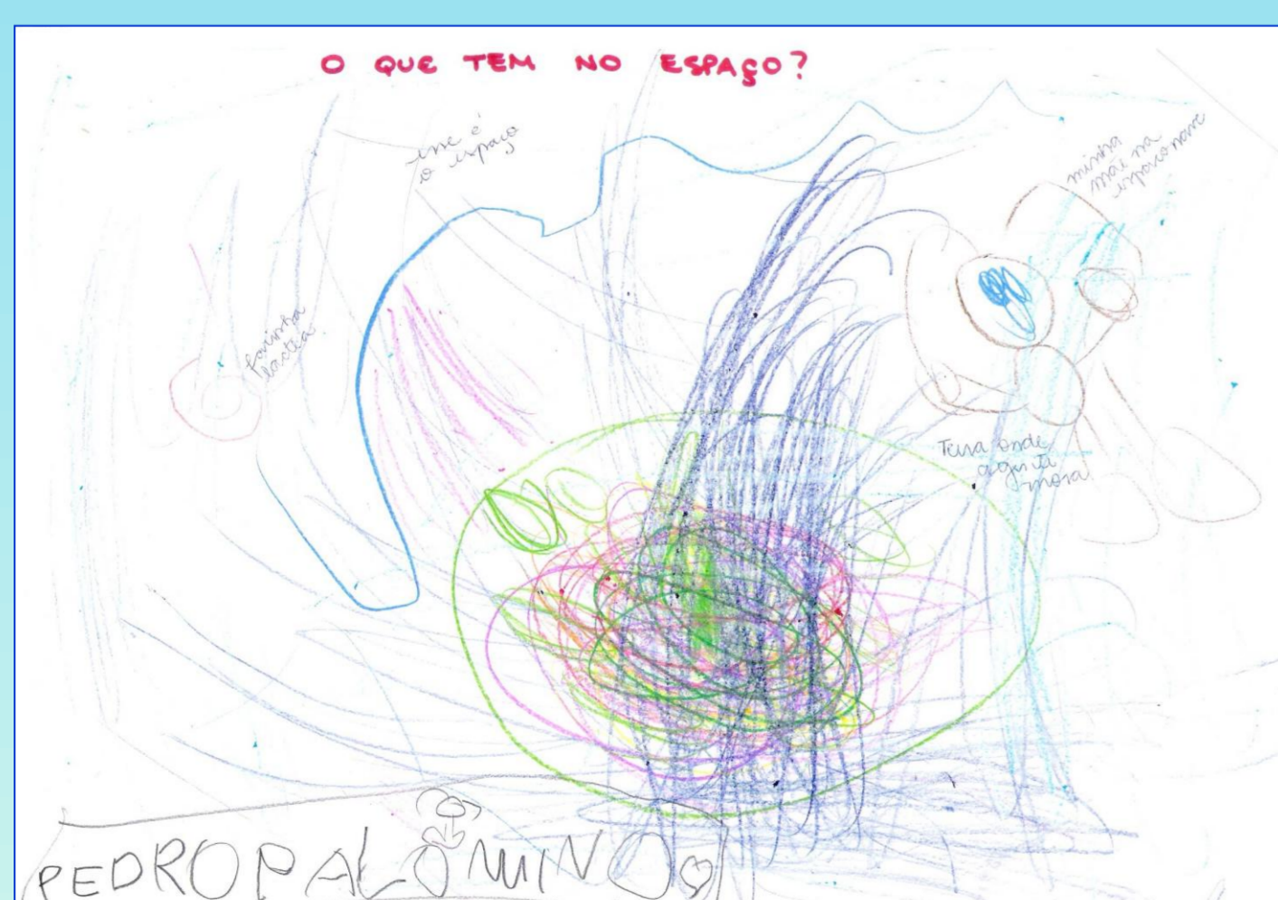
FIGURA 1: Sondagem