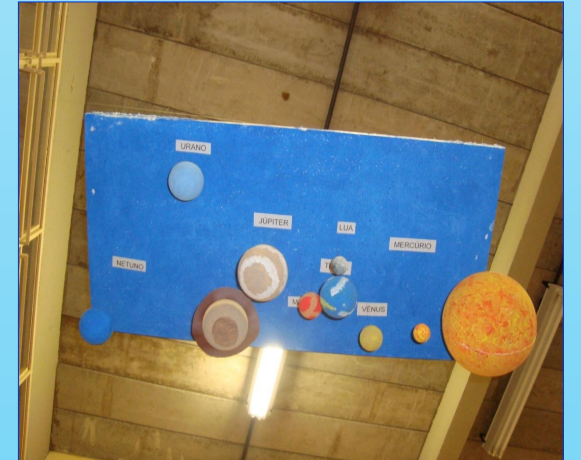
FIGURA 3: Planetário MóBILE