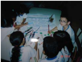
Relato das crianças para construção de texto coletivo e ilustrações