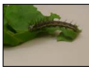
LAGARTA Nº 3