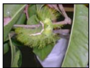
LAGARTA Nº 1

Apenas esta última virou borboleta, durante as férias de julho. Felizmente, tudo foi filmado e fotografado para ser mostrado às crianças no retorno às aulas.