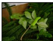
LAGARTA Nº 2