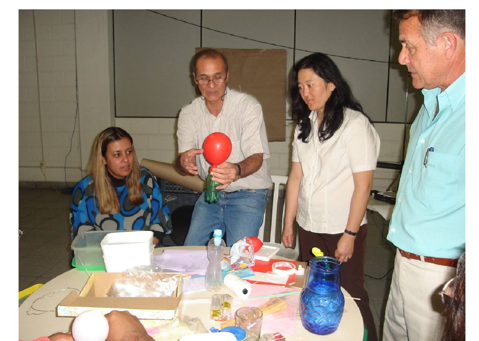
Acompanhamento da formação nas Coordenadorias de Educação