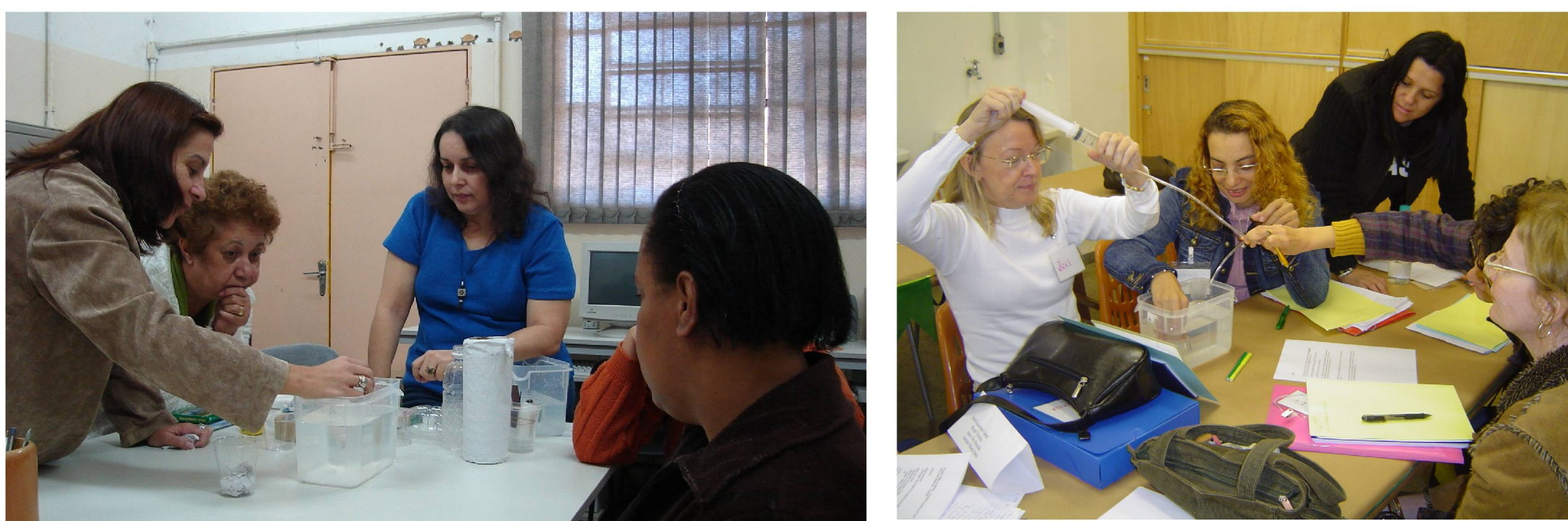
Acompanhamento do Encontro do formador da Coordenadoria de Educação com Coordenadores Pedagógicos

Algumas escolas desenvolviam o projeto antes do estabelecimento da parceria entre Estação Ciência e Secretaria Municipal de Educação. Entretanto, outras iniciaram o projeto concomitantemente aos encontros de formação na Estação Ciência. Isso justifica os diferentes estágios quanto à apropriação da metodologia e sua prática na sala de aula.