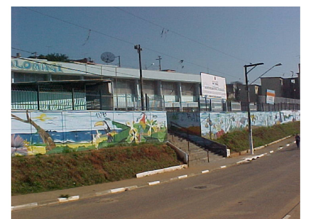
Duas das escolas acompanhadas