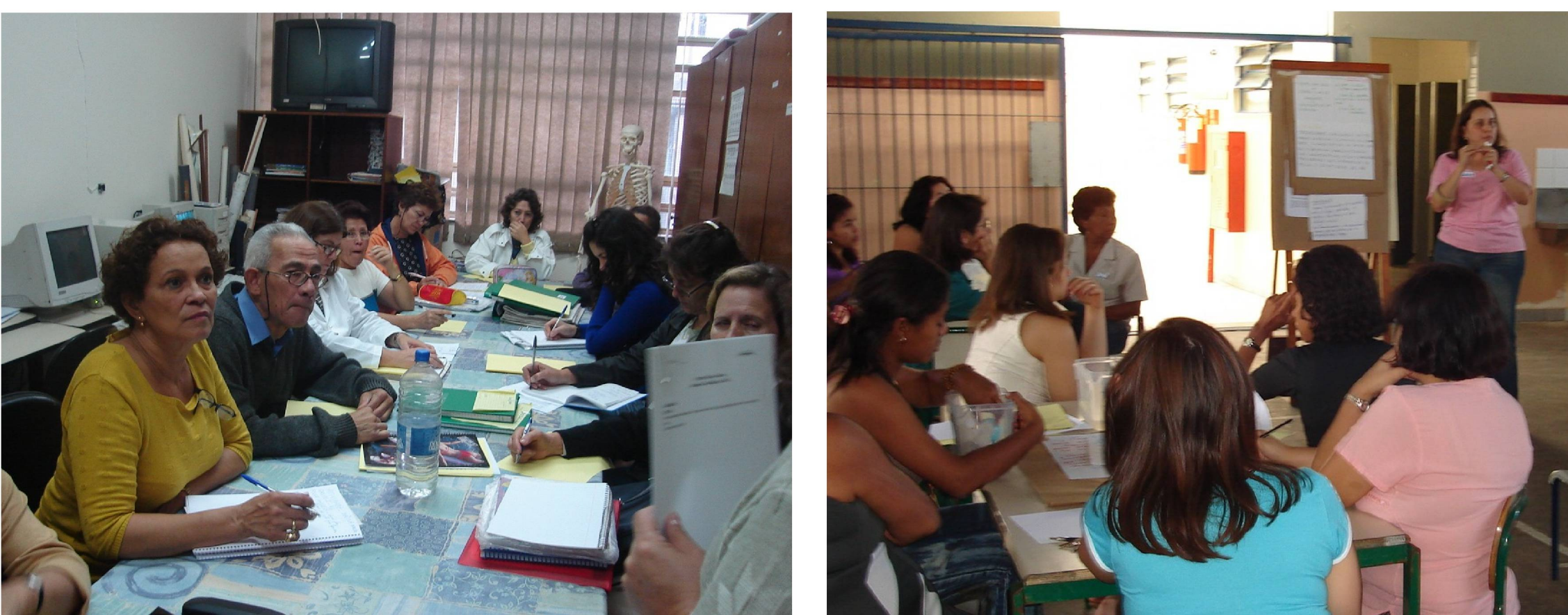
Acompanhamento do Encontro de formação com os Professores nas escolas

Algumas escolas desenvolviam o projeto antes do estabelecimento da parceria entre Estação Ciência e Secretaria Municipal de Educação. Entretanto, outras iniciaram o projeto concomitantemente aos encontros de formação na Estação Ciência. Isso justifica os diferentes estágios quanto à apropriação da metodologia e sua prática na sala de aula.