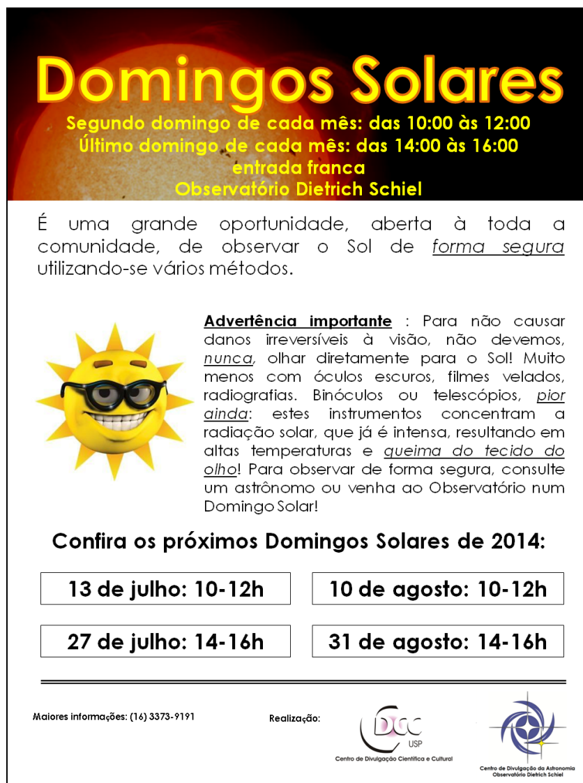
Figura 3: cartaz do Domingo Solar, com as datas e horários correspondentes a um bimestre.

Os recursos da Sala Solar são explorados em dois segmentos de público, o escolar e o espontâneo. O público escolar é atendido durante a semana, enquanto que visitas do público espontâneo têm lugar em duas ocasiões mensais nos chamados “Domingos Solares”, que ocorrem no segundo e no último domingo de cada mês, em horários matutino e vespertino, respectivamente (figura 3).