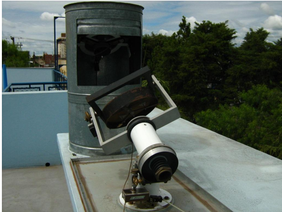
Figura 1: O heliostato, localizado no teto da Sala Solar.