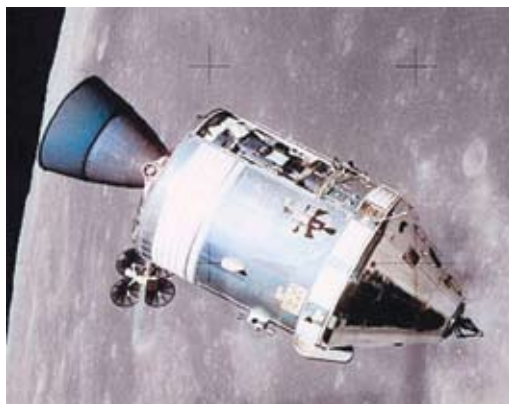
Módulo de Comando e Serviço visto no espaço a partir do Módulo Lunar.