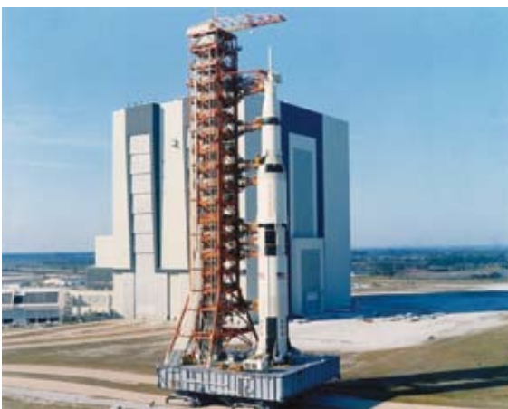
Saturno V sendo conduzido do prédio de integração e testes para a plataforma de lançamento. Ao fundo, se tem o prédio de integração e testes, onde o Saturno V é testado, integrado e posicionado em sua configuração de lançamento.

O terceiro estágio tinha cerca de 17,5 m de altura e seu diâmetro era de 10m na parte inferior, 6,3m na superior e usava um único motor J-2. Esse terceiro estágio era usado duas vezes durante a missão: na primeira, para terminar de inserir a nave em órbita da Terra e, posteriormente, para dar à nave o empuxo suficiente para injetá-la em sua órbita em direção à Lua – trans lunar injection (TLI) . Entre um e outro evento, os motores permaneciam desligados. Assim, o terceiro estágio funcionava inicialmente por cerca de 2,5 minutos, terminando de inserir a nave em órbita da Terra. Após esse tempo, o motor era desligado e a nave permanecia em