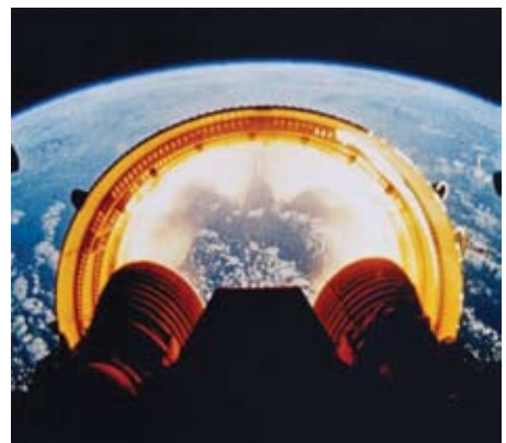
O Anel de separação se desprende do segundo estágio do Saturno V.