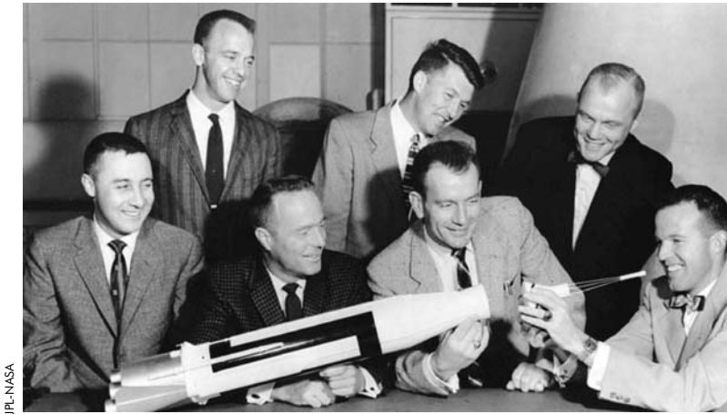
Os 7 astronautas selecionados para o Programa Mercury - Grissom, Shepard, Carpenter, Schirra, Slayton, Glenn, Cooper (da esquerda para a direita).

esforço coordenado das milhares de pessoas envolvidas no Programa Mercury, sendo, aos olhos do público, os verdadeiros protagonistas e heróis dos fatos memoráveis que se seguiriam.