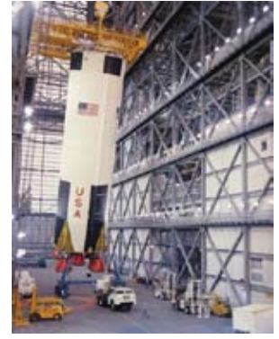
Primeiro estágio do Saturno V, sendo manipulado no interior do prédio de integração e testes.

um empuxo de 35,02MN, o suficiente para elevar o lançador até a altura de 61km e a uma velocidade de 8.600km/h.