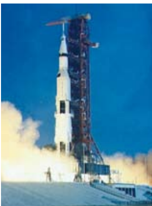
A Apollo 11, a caminho da Lua, em 16 de julho de 1969.

O motor de empuxo ajustável do LM começou a funcionar continuamente. Sete minutos mais tarde, eles estavam a 6km da superfície e o computador de bordo continuava a controlar a trajetória de descida. À 2 km do solo, o computador manobrou o ML , colocando-o na posição vertical própria para pouso. Com isso, Armstrong e Aldrin puderam ver, pela primeira vez, o solo lunar.