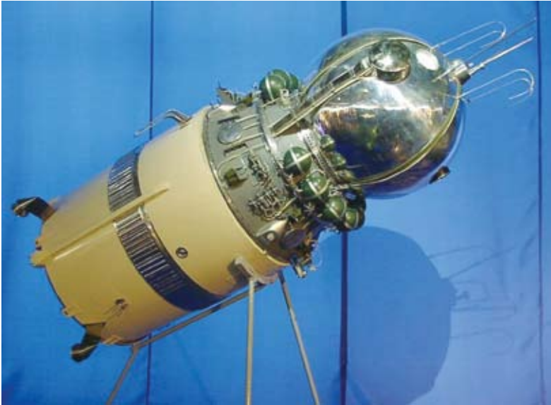
Modelo da nave Vostok, que conduziu os primeiros cosmonautas soviéticos ao espaço.