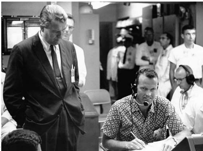
Werner von Braun – o engenheiro responsável pelo desenvolvimento do Saturno V, ao lado do astronauta Gordon Cooper, em 1961.

Dias mais tarde, os astronautas foram condecorados pelo presidente e participaram de paradas de aclamação em várias capitais americanas. Receberam inúmeras mensagens de congratulações, incluindo as dos soviéticos, que aclamaram o fato como uma “conquista do progresso científico e tecnológico da humanidade”. Já Thomas O. Paine, o Diretor da NASA, em seu discurso de recepção, disse: “Este vôo representa um dos maiores e pioneiros esforços empreendidos pela humani-