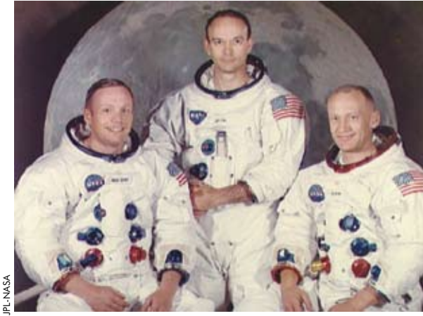
Os astronautas da Apollo 11 - Neil Armstrong, Comandante, Michael Collins, Piloto do Módulo de Comando, e Edwin "Buzz" Aldrin, Piloto do Módulo Lunar (da esquerda para a direita).

No dia 20 de julho de 1969, enquanto a nave passava pela face oculta da Lua, o Módulo Lunar , batizado de Águia , se separou do Módulo de Comando e iniciou a descida. A bordo estavam Neil Armstrong e Edwin Aldrin. Quando Armstrong e Aldrin estavam à 15 km da superfície, o visor verde do computador de bordo mostrou o número 99. Era a indicação para Armstrong de que ele tinha apenas 5 segundos para decidir se iria alunissar ou retornar ao Módulo de Comando . Ele pressionou o botão de "prosseguir".