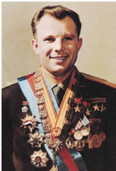
O cosmonauta soviético Yuri Gagarin que, em 12 de abril de 1961 se tornou o primeiro homem a viajar ao espaço, a bordo da nave Vostok I.

na atmosfera e posou em terra firme, trazendo o cosmonauta de volta em perfeitas condições de saúde. A missão foi um sucesso em todos os sentidos e Gagarin entrou para a história como pertencente ao seleto grupo dos grandes exploradores pioneiros de todos os tempos. O vôo orbital levou-o ao espaço, em ambiente de microgravidade, fazendo-o permanecer lá por cerca de 89 minutos. Gagarin foi ao espaço a partir da base espacial soviética situada em Baikonour, sendo provavelmente lançado por um veículo lançador de dois estágios. Sua cápsula orbital de 5,2 toneladas – quase cinco vezes mais pesada que a americana, e 2,3m de diâmetro, atingiu uma altura máxima de 326km acima do nível do mar, percorrendo uma distância de cerca de 40.000km, chegando a uma velocidade pouco superior a 28.000km/h.