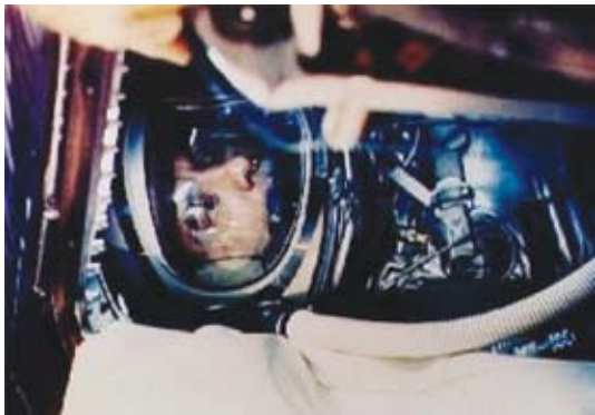
Astronauta Alan Shepard em posição de lançamento, a bordo de sua cápsula Freedom 7.

E, mais ainda, bem antes que esse programa americano viesse a ser empreendido, os soviéticos conquistaram um novo e retumbante êxito.