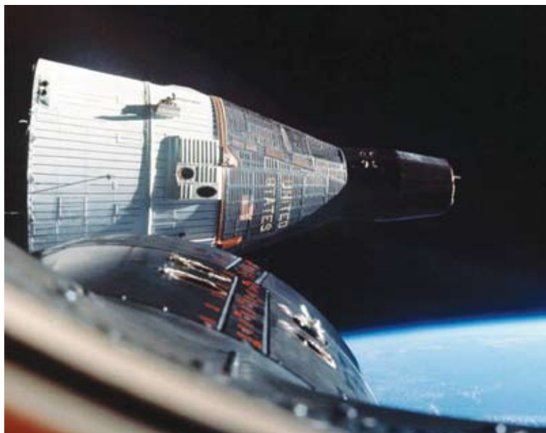
Gemini 6A, vista da Gemini 7, enquanto as duas naves voavam a menos de 7 metros uma da outra.