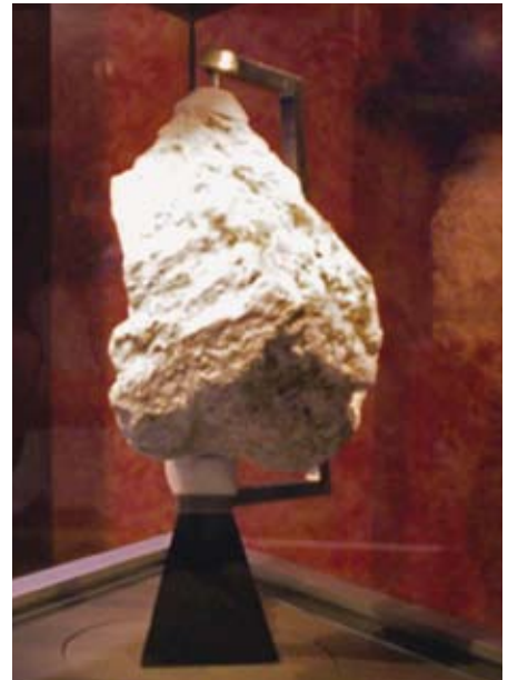
Uma das muitas amostras trazidas da Lua pelas missões Apollo.

Em conjunto, as missões trouxeram para a Terra cerca de 380kg de pedras e materiais da Lua. A análise desses materiais revelou que, em geral, estas pedras são muito mais antigas do que as que são encontradas na superfície da Terra, sendo datadas entre 3,2 e 4,6 bilhões de anos. A Apollo 15 encon-