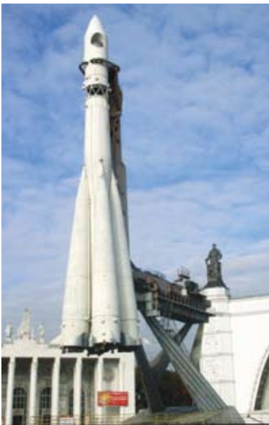
Foguete soviético Vostok, colocou em órbita os primeiros cosmonautas soviéticos.

mais um americano. Pior do que isso foi mais uma vez constatar o quão à frente dos americanos os soviéticos estavam na corrida espacial.