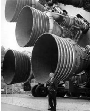
Motores F-1 do primeiro estágio do foguete Saturno V comparados à estatura de seu criador, Werner von Braun.