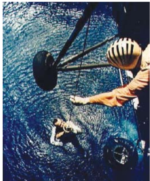
Astronauta Alan Shepard sendo retirado de sua cápsula espacial, após seu voo ao espaço.