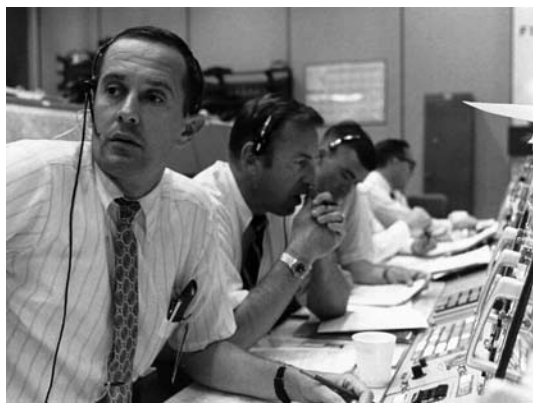
Controladores de vô acompanhando a descida do Módulo Lunar "Águia".

Quando o LM estava apenas a 100m do solo e se preparando para alunisar, os astronautas perceberam que o local em que pousariam estava repleto de pedras. Armstrong passou o pouso para o modo semi-automático no qual o computador controlava o empuxo do motor, mas era ele quem guiava o módulo lunar. Por 90 segundos, procurou um local apropriado para pouso. Finalmente, com o combustível quase se esgotando, achou o local adequado: o LM pousou suavemente e o botão com a marca "parada" é acionado. Segundos depois, o Centro de Missão ouviu pelo rádio a frase histórica de Armstrong: "Houston, aqui é a Base da Tranquilidade. A Águia pousou". Eram 17h17m, horário de Brasília e o Centro de Missão "explodiu" em alegria e comemorações. Finalmente conseguiram!