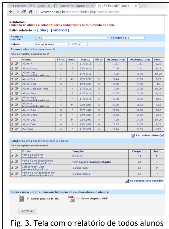
Fig. 3. Tela com o relatório de todos alunos